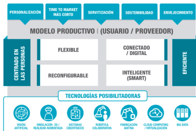
Figura 2: Modelo de referencia

En este modelo de referencia hay tres niveles: Uno relacionado con las tendencias o drivers, el segundo relacionado con el modelo productivo y, por último, con las tecnologías posibilitadoras. Estos tres niveles están de alguna manera relacionados con los tres niveles mencionados anteriormente como guía de nuestra reflexión: El posicionamiento estratégico de la empresa estará relacionado/alineado con aquellos drivers o tendencias que pueden impactar más significativamente en su negocio. Puede ser la personalización, los ciclos de vida más cortos, las sostenibilidad o similares. El modelo productivo de fabricación avanzada Industria 4.0 tendrá como características: