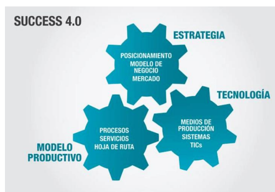
Figura 1: Niveles de la industria 4.0

Las empresas se cuestionan cómo les puede afectar todo este movimiento a su negocio para reaccionar en consecuencia (estrategia defensiva) o analizar qué oportunidades ofrece este nuevo escenario (estrategia pro-activa). En cualquiera de los casos la reflexión se realiza a tres niveles: