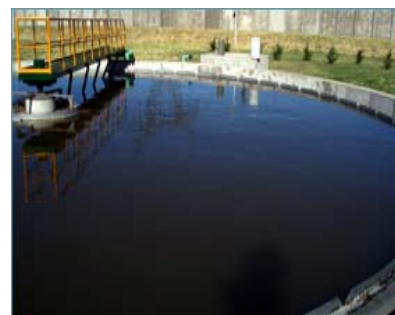
Figura 2. Aguas residuales de Tenería