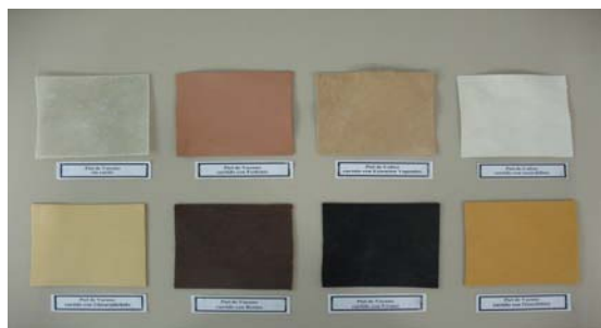
Figura 3. Muestras de pieles utilizadas en los diferentes ensayos.

Diferentes muestras de cuero y colágeno, en forma de polvo, fueron seleccionadas para la realización de los diferentes ensayos. Hasta el momento un total de ocho pieles curtidas de diferentes maneras fueron empleadas en los ensayos (figura 3). Las pieles empleadas en los estudios fueron curtidas con cromo, resina vegetal, fosfonio, oxazolidina y glutaraldehído.