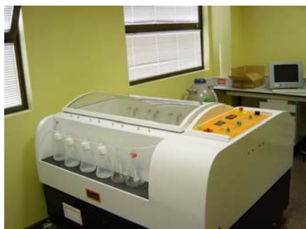
Figura 1A. Equipo de ensayo

La evaluación de la biodegradación se hace por la medida indirecta del CO 2 generado en función del tiempo y calculando el grado de biodegradabilidad por la diferencia del contenido de carbón soluble orgánico que no ha sido convertido en CO 2 durante el proceso.