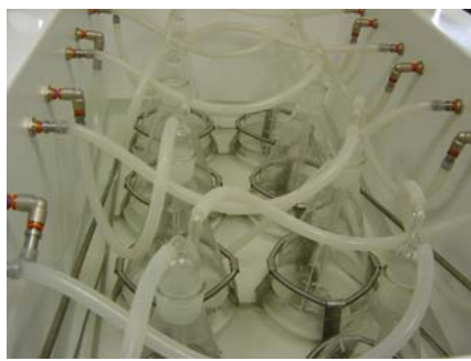
Figura 1B. Detalle del equipo de ensayo